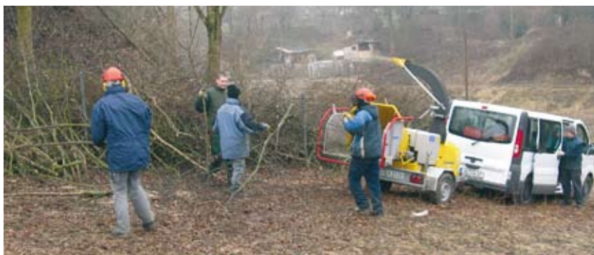
ESF-Projekt „FIT“ der AWO: Jugendliche beim Einsatz

Gefördert werden innovative Projekte, die sich auf die Schwerpunkte „Verbesserung des Humankapitals“ oder „Verbesserung des Zugangs zur Beschäftigung sowie die soziale Eingliederung benachteiligter Personen“ beziehen. Der regionale Arbeitskreis ESF im Alb-Donau-Kreis traf eine Vorauswahl unter den eingereichten Projektanträgen.