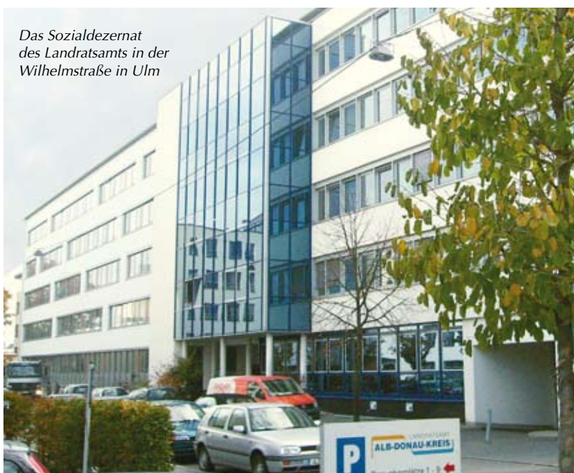
Das Sozialdezernat des Landratsamts in der Wilhelmstraße in Ulm

Die Anzahl der Bedarfsgemeinschaften beim Landratsamt weichen in der Regel etwas von den gemeldeten Zahlen der Agentur für Arbeit ab.