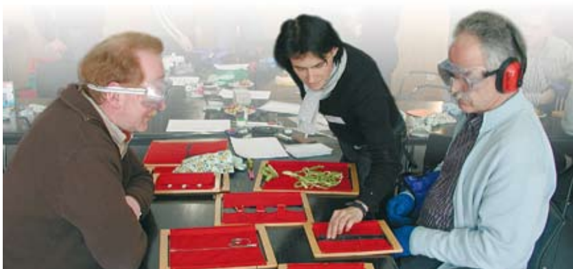
Erlebte Behinderung: Ein Selbstversuch bei der Aktion „leichter Leben“

Am 18. Februar 2009 fand dazu im Haus des Landkreises ein erstes Seminar statt. Dabei wurden den teilnehmenden Betrieben Möglichkeiten für Sanierungs- und Umbaumaßnahmen vorgestellt, damit älteren und behinderten Menschen möglichst lange ein selbstbestimmtes Leben in gewohnter Umgebung ermöglicht wird. Unter anderem konnten die Seminarteilneh-