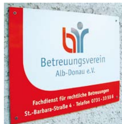
Anlaufstelle für Menschen aus dem Landkreis: Der Betreuungsverein mit Büro in Ulm

Die Betreuungsbehörde beim Landkreis übernimmt für die Betreuungsgerichte unterstützende