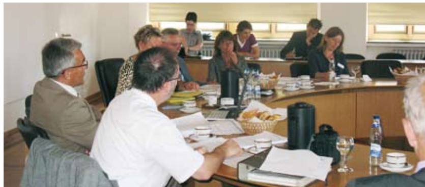
Sommerlichen Temperaturen und ein enormes Arbeitspensum: Im Trägerforum wurden erste Weichenstellungen zur regionalen Neuorientierung in der Eingliederungshilfe beschlossen

Diese Aufgabe wurde im Jahr 2005 vom Landeswohlfahrtsverband auf die Stadt- und Landkreise übertragen. Für den Alb-Donau-Kreis und die Stadt Ulm gibt es seit 2008 einen gemeinsamen Teilhabeplan für Menschen mit wesentlicher Behinderung. Damit sollen die Unterstützungsmöglichkeiten für behinderte Mitbürger bedarfsgerecht ausgebaut werden. Besonderen Wert wird dabei auf frühzeitige Förderung, größtmögliche Selbstständigkeit und Selbstbestimmung sowie wohnortnahe und bedarfsgerechte Angebote gelegt.