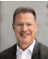
Heiner Scheffold Landrat Alb-Donau-Kreis