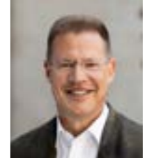
Heiner Scheffold Landrat Alb-Donau-Kreis