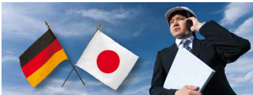
Der neue Aufenthaltstitel im Ausländerrecht betrifft auch japanische Fachkräfte in Deutschland.

Darüber hinaus gibt es nun zwei neue Aufenthaltstitel, die ICT (Intra Corporate Transfer)- Karte und die Mobiler-ICT-Karte.