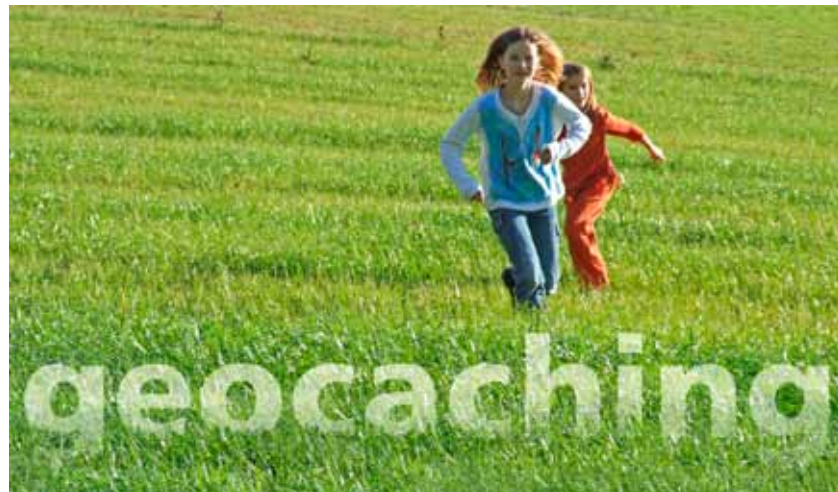
„Geocaching“ (geo „Erde“ und englisch cache „geheimes Lager“): Schatzsuche mit GPS-Geräten vom Kreismedienzentrum

Derzeit ist das Kreismedienzentrum Ulm zusammen mit der Jugendpflege des Alb-Donau-Kreises und der Familienbildungsstätte Ulm an den „Munderkinger Medienprojekten“ beteiligt, die sich der Medienerziehung im Primarschulbereich widmen.